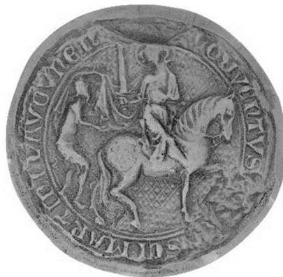
Quatrième grand sceau conventuel de Saint-Martin de Laon (cat. 173) France, dioc. de Laon, 1 re moitié du XIV e siècle, Ø 69 mm (Paris, Arch. nat., Sc/Ch 2314)

Carte et cahier d'illustrations couleur, p. 321