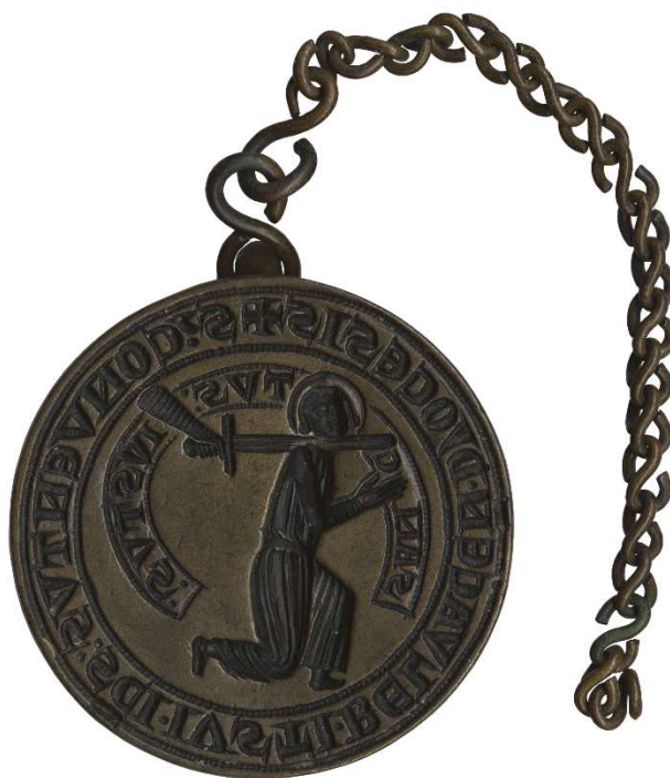
Matrice du sceau conventuel de l'abbaye de Saint-Just-en-Chaussée (cat. 277). France, diocèse de Beauvais, vers 1300. Ø 60 mm. Paris, Arch. nat., Sc/Mat/200