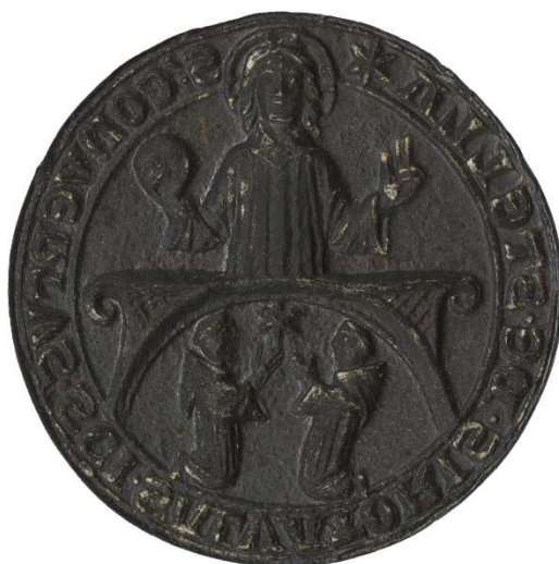
Matrice du sceau conventuel de l'abbaye de l'Étoile (cat. 130). France, diocèse de Chartres, vers 1250. Ø 52 mm. Paris, Arch. nat., Sc/Mat/863

Un volume broché, 20×27 cm, 336 p., ill. noir et blanc et couleur ISSN : 1158-3355 - Prix : 40 €