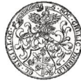
Société française d'Héraldique et de Sigillographie - SFHS