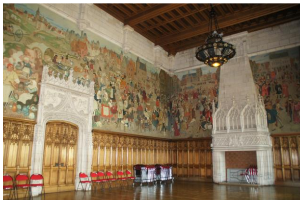
◁ L'hôtel de ville d'Arras - City Hall