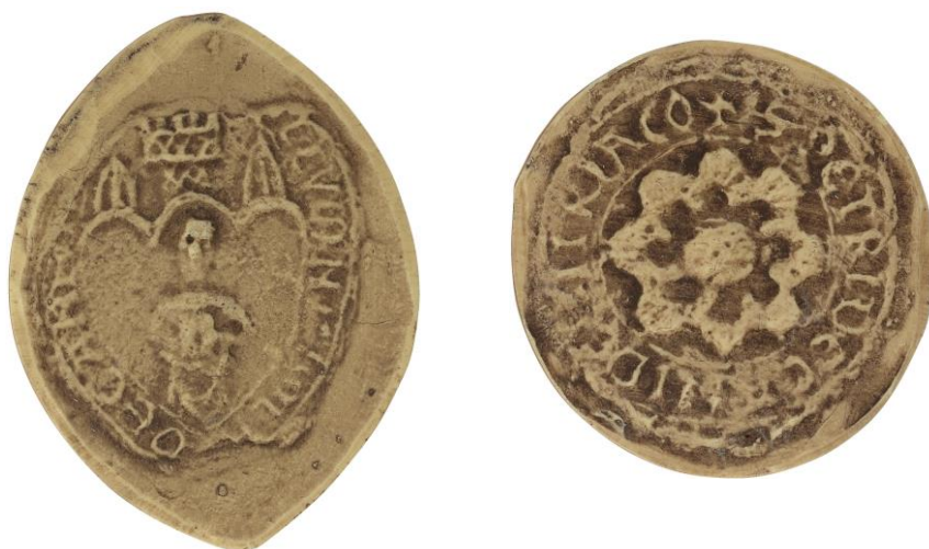
40. Nicolas, doyen de chrétienté de Vitry, fin XII e s., h. : 50 mm [...SIG]ILLVM NICHOLA[I] DECANI VI[...] Arch. nat., Sc/Ch/2090