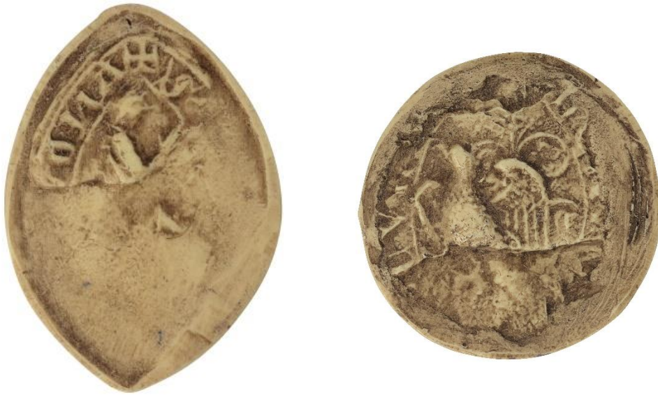
36. Pierre Pauvre, doyen de chrétienté de Joinville, 1258, h. : 38 mm ✠ [...]ONA Arch. nat., Sc/Ch/1984