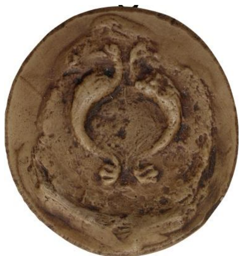
33. Jean, doyen de chrétienté de Solesmes, 1194, Ø 40 mm Légende détruite Arch. nat., Sc/F/6507