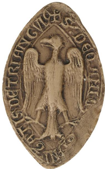
166. N., doyen de chrétienté de Traînel, 1220, h. : 55 mm ✠ S' : DECANI C[HRISTIA]NITATIS DE TRIANGVLO Arch. nat., Sc/D/7931