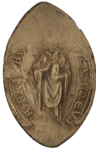
4. Guillaume, doyen de chrétienté d'Abbeville, 1243, h. : 60 mm [SIGI]LLI : DE VI[...]A : PR[ES]BI[TERI] Arch. nat., Sc/P/1264