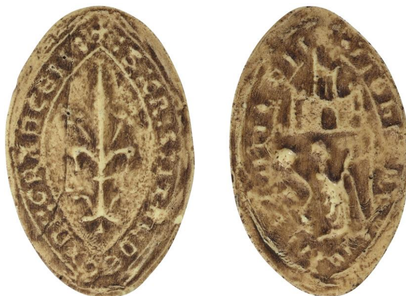
92. Chrétien, doyen de chrétienté de Grancey, 1248, h. : 50 mm ✠ : S : CRISTIANI : DECANI : GRANCII Arch. nat., Sc/Ch/1979