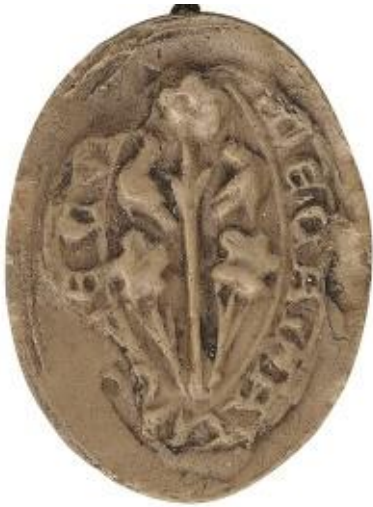
19. N., doyen de chrétienté de Cuves, 1 e moitié XIII e s., h. : 30 mm [...]DECAINETVS DE CV[VIS] Arch. nat., Sc/D/7875