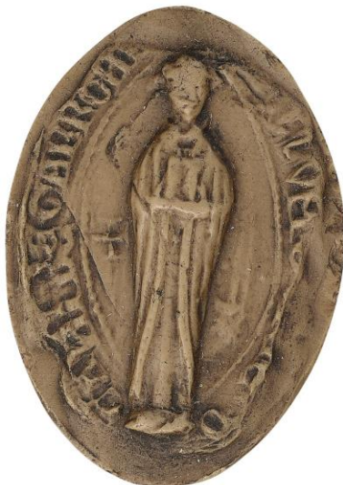
50. N., doyen de chrétienté de Gavray, 1256, h. : 46 mm [...] S]ILLVM [...] E D/[E]CANI DE GABRONI[O] Arch. nat., Sc/D/7893