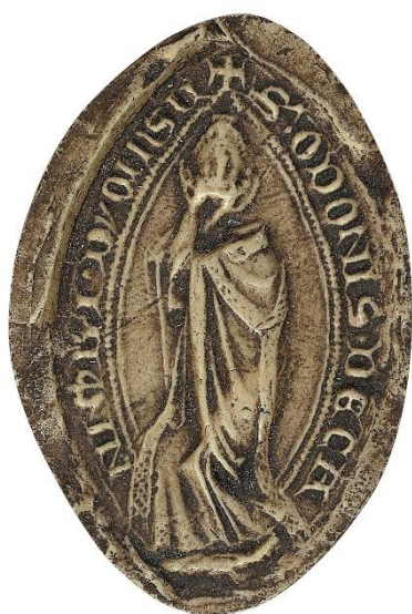
125. Guillaume, doyen de chrétienté de Lagny, 1215, h. : 46 mm [...]LM • [D]ECANI : DE : LANIA[CO] Arch. nat., Sc/D/7896