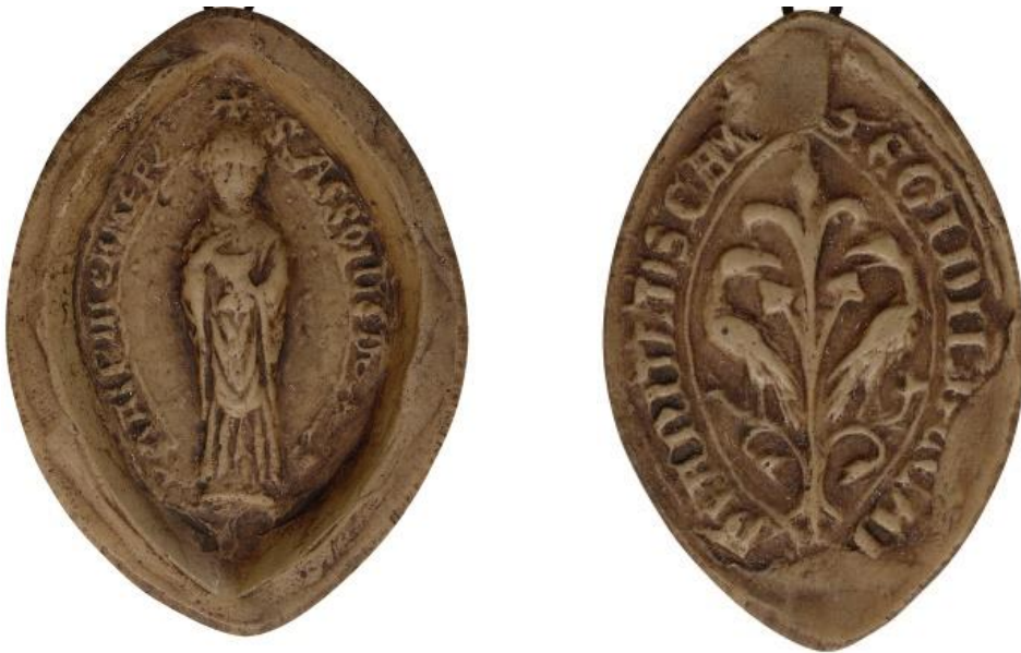
27. Asson, doyen de chrétienté de Cambrai, 1200, h. : 43 mm ✠ S'ASSONIS DE[CANI] XPIAN(itatis) IN CAMER(aco) Arch. nat., Sc/F/6483