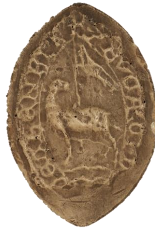
20. Landry, doyen de chrétienté de Beaumont-sur-Oise, 1258, h. : 35 mm / S'• DECANATVS DE BELLOMO(n)TE Arch. nat., Sc/D/7879