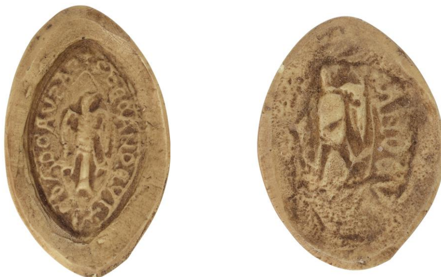
46. Robert, doyen de chrétienté de Vertus, 1253, h. : 38 mm ✠ S DÉCANI DE VITRIACO AD CAVSAS Arch. nat., Sc/Ch/2009