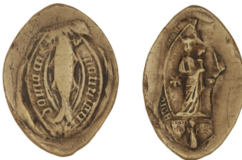
149. Étienne Jagleuley, doyen de chrétienté de Pont-Audemer, 1445, h. : 30 mm S PONTIS AUDOM(ari) A(d) C(aus)AS Arch. nat., Sc/N/2501