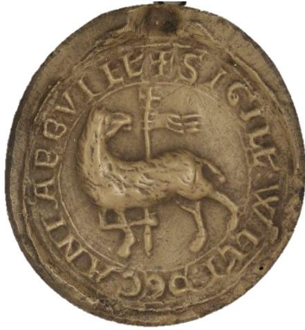
1. Guillaume, doyen de chrétienté d'Abbeville, 1225, Ø 40 mm ✠ SIGILL(um) : WILL(erm)I : DECANI ABB(atis)VILL(e) Arch. Nat., Sc/P/1263