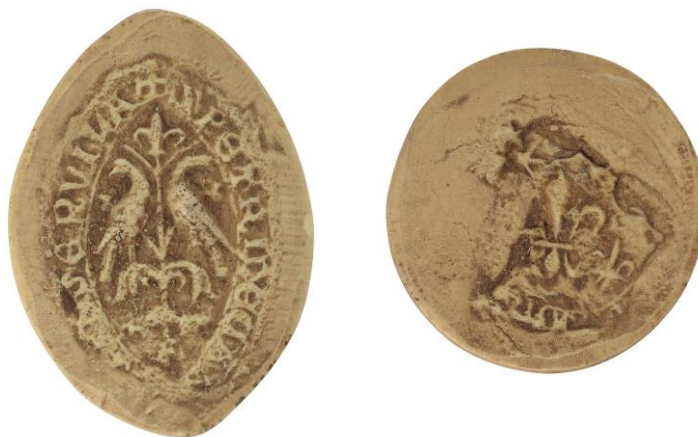
173. Pierre, doyen de chrétienté d'Ancerville, 1255, h. : 43 mm ✠ S' PETRI DEC[...A]SSERVILLA Arch. nat., Sc/Ch/1951