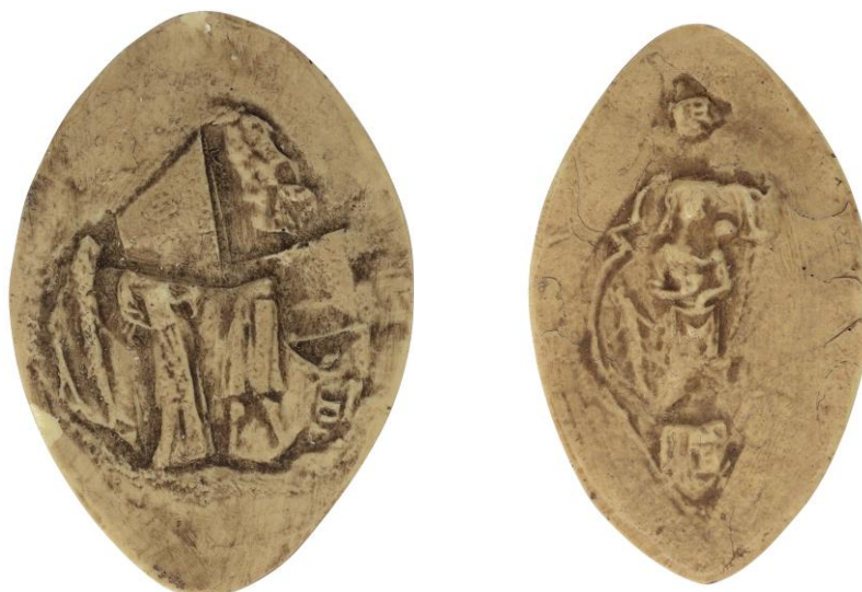
65. Jean de Chaumont, doyen de chrétienté de Bar-sur-Aube, 1305, h. : 45 mm Légende détruite Arch. nat., Sc/Ch/1960