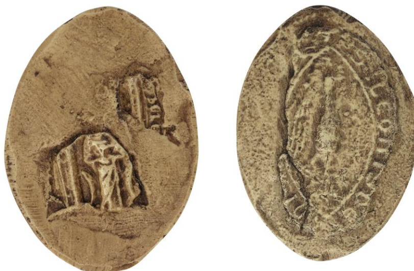
67. Nicolas Fraiscllet, doyen de chrétienté de Bar-sur-Aube, 1355, h. : 40 mm [...]AYSCLLET [...] Arch. nat., Sc/Ch/1963