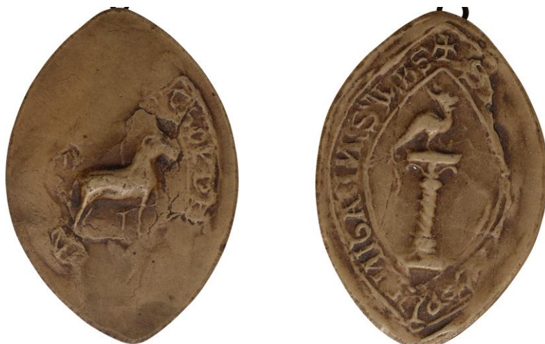
188. Nicolas, doyen de chrétienté de Lille, 1217, h. : 60 mm [...N]ICHOL(ai) DE [...]IN[...] Arch. nat., Sc/F/6497