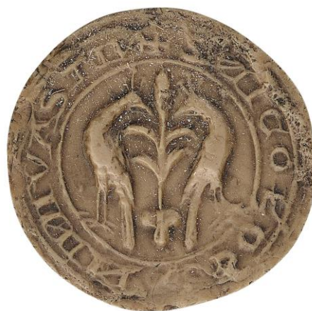
156. Étienne, doyen de chrétienté du Gâtinais, 1242, h. : 40 mm [...] N [...] DE [CA]NI • WAS [...] Arch. nat., Sc/B/1169