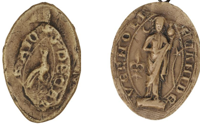
51. N., doyen de chrétienté de Bray, 1285, h. : 25 mm ✠ S' DECA[N]I DE B]RAIO Arch. nat., Sc/N/2489