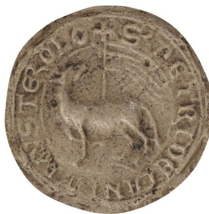
158. Nicolas, doyen de chrétienté de Milly, 1277, Ø 30 mm ✠ S DECANI XPRI(stia)NITATIS MILIACI AD CA(ausa)S Arch. nat., Sc/D/7913