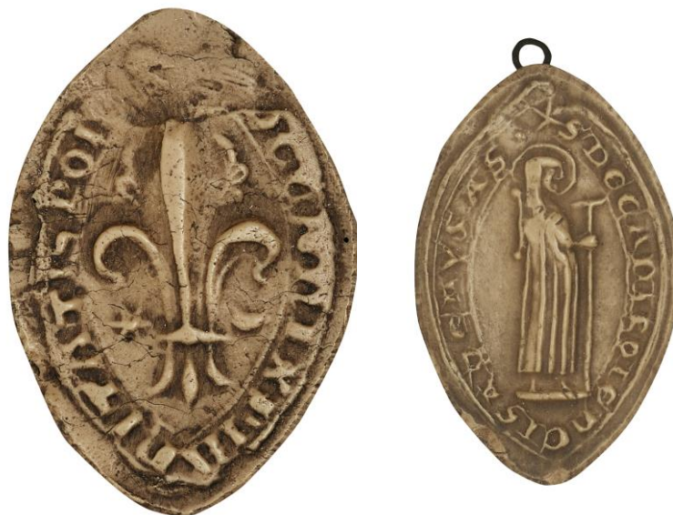
121. N., doyen de chrétienté de Péronne, 1296, h. : 36 mm [...] DECANI XRI(sti)ANITATIS P(er)ON[...] Arch. nat., Sc/A/2497