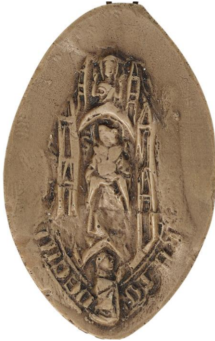
196. Thomas, doyen de chrétienté de Seclin, 1321, h. : 45 mm Légende détruite Arch. nat., Sc/D/7929