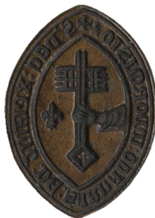
130. N., doyen de chrétienté de Cernay-en-Dormois, 1300-1400, h. 35 mm ✠ S'DEC(ani) : XPIANIT(at)is) : DE : SARNECO : INDORMISIO