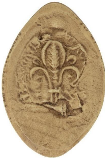
3. Jean, doyen de chrétienté d'Abbeville, 1258, h. : 38 mm Légende détruite Arch. nat., Sc/Ch/1950