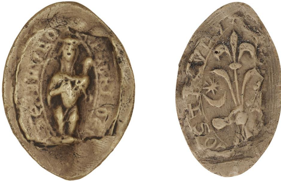
48. Pierre de la Lande, doyen de chrétienté de Brézolles, 1254, h. : 42 mm [...] PETRI DEC[AN]I DE BRVRO[...] Arch. nat., Sc/N/2490