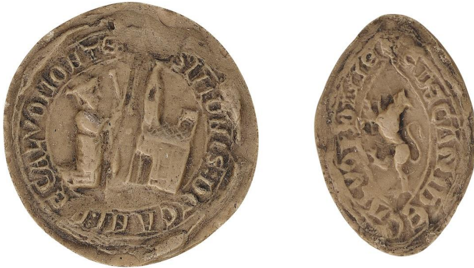
135. Simon, doyen de chrétienté de Chaumont-en-Vexin, 1240, Ø 30 mm [...] SIMONIS : DECANI • DE CALVOMONTE Arch. nat., Sc/D/7882