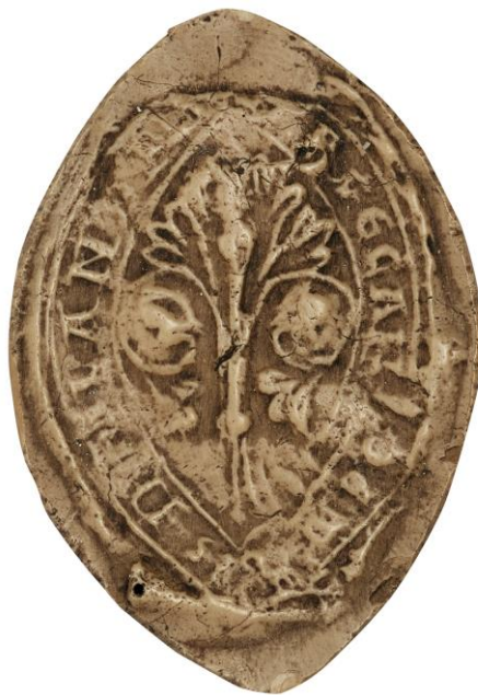
169. N., doyen de chrétienté de Bergues, 1241, h. : 42 mm [...] H DECANI DE BERGIS D[E F]LAND[...] Arch. nat., Sc/A/2496