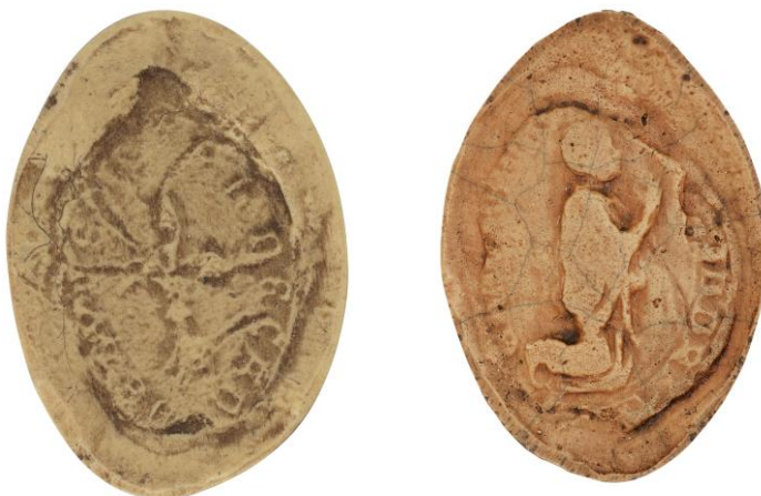
206. N., doyen de chrétienté de Domrémy, 1228, h. : 37 mm [...] H DECAN[... ]DE [...] Arch. nat., Sc/Ch/1978