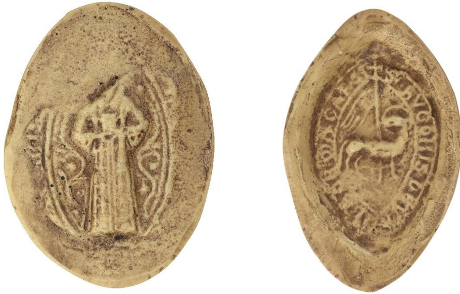
199. N. doyen de chrétienté de Margerie, 1200-1250, h. 45 mm Légende détruite