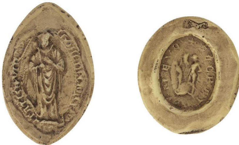
38. Thomas, doyen de chrétienté de Vertus, 1240, h. : 42 mm [...] THOME DECANI [...]TATIS DE VIRTV[TO] Arch. nat., Sc/Ch/2003