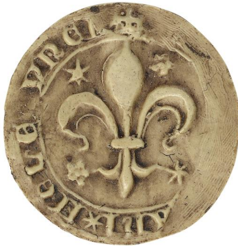
116. Martin, doyen de chrétienté de Melun, 1280, Ø 31 mm S' MARTINI DECANI M[ELEDV]NE[N](sis) Arch. nat., Sc/D/7901