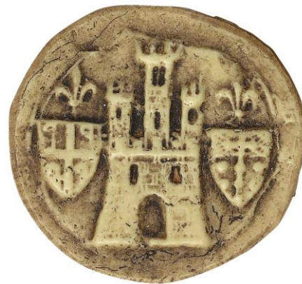
117. Jean, doyen de chrétienté de Melun, 1289, Ø 30 mm [...DEC]ANI (une étoile) MELE[D]VNEN(sis) Arch. nat., Sc/D/7902