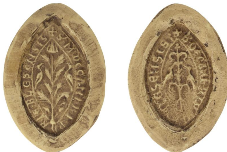
182. Manassès, doyen de chrétienté de Rivière de Blaise, 1232, h. : 57 mm ✠ S' • M DECANI RIPARIE • BLESENSIS Arch. nat., Sc/Ch/2052