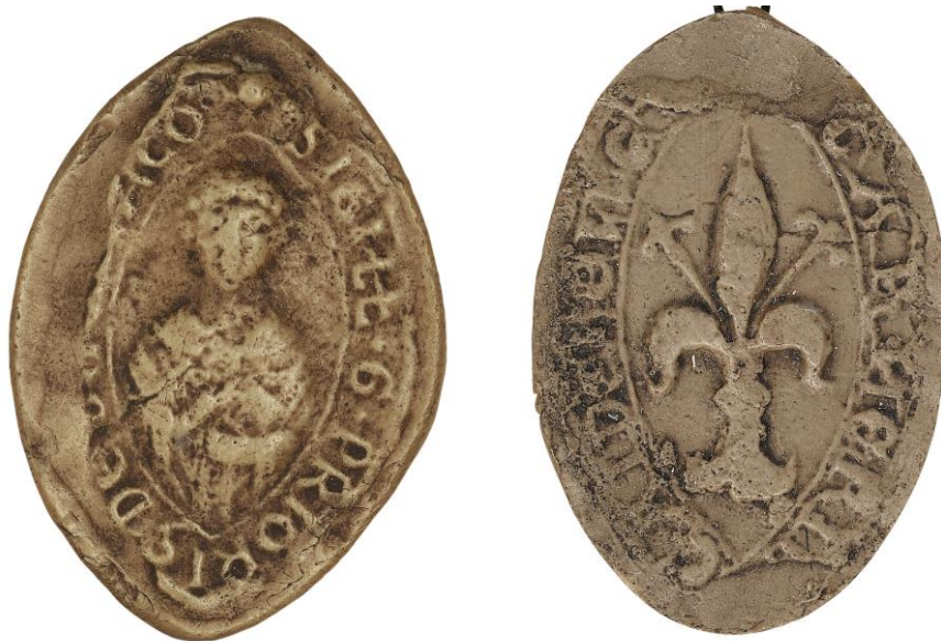
139. Guerri, doyen de chrétienté de Magny, 1219, h. : 39 mm ✠ SIGILL(um) • G • PRIORIS DE [...]JACO Arch. nat., Sc/N/2494