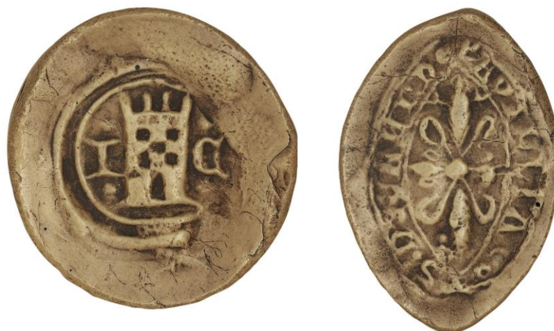
147. Jean Coquin, doyen de chrétienté de Neufchâtel, 1445, Ø 14 mm Anépigraphhe Arch. nat., Sc/N/2497