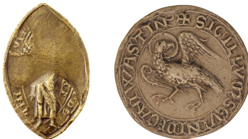
154. Renaud, doyen de chrétienté de Ferrières-en-Gâtinais, 1242, h. : 46 mm [...] DECANI [...]V[...] Arch. nat., Sc/B/1168