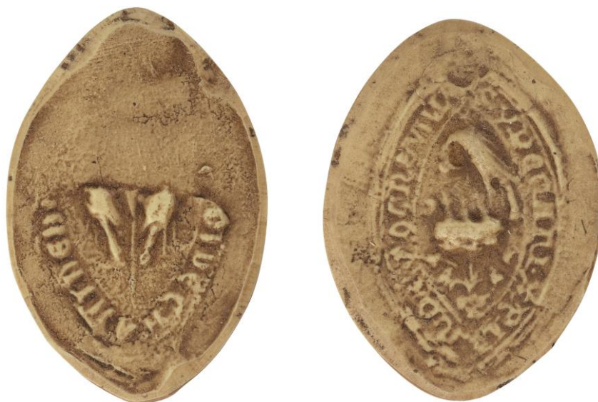
180. N., doyen de chrétienté de Robert-Espagne, 1246, h. : 42 mm [...] DI DE CHANT DE NO [...] Arch. nat., Sc/Ch/1997