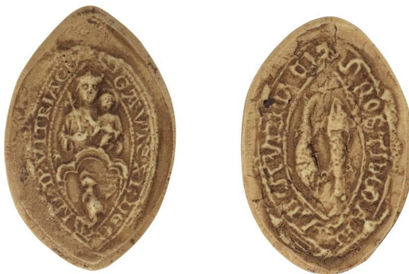
44. Gautier, doyen de chrétienté de Vertus, 1241, h. : 40 mm [...] S GAVTERI : DECANI : D(e) : VITRIACO Arch. nat., Sc/Ch/2007