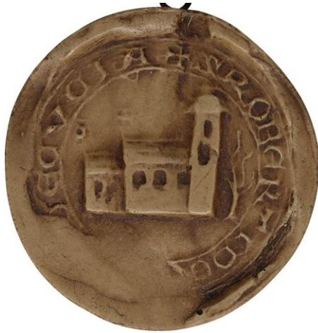
168. Robert, doyen de chrétienté de Cuise, 1217, Ø 34 mm ✠ S ROBERTI DE[CANI] DE CVCIA Arch. nat., Sc/F/6487