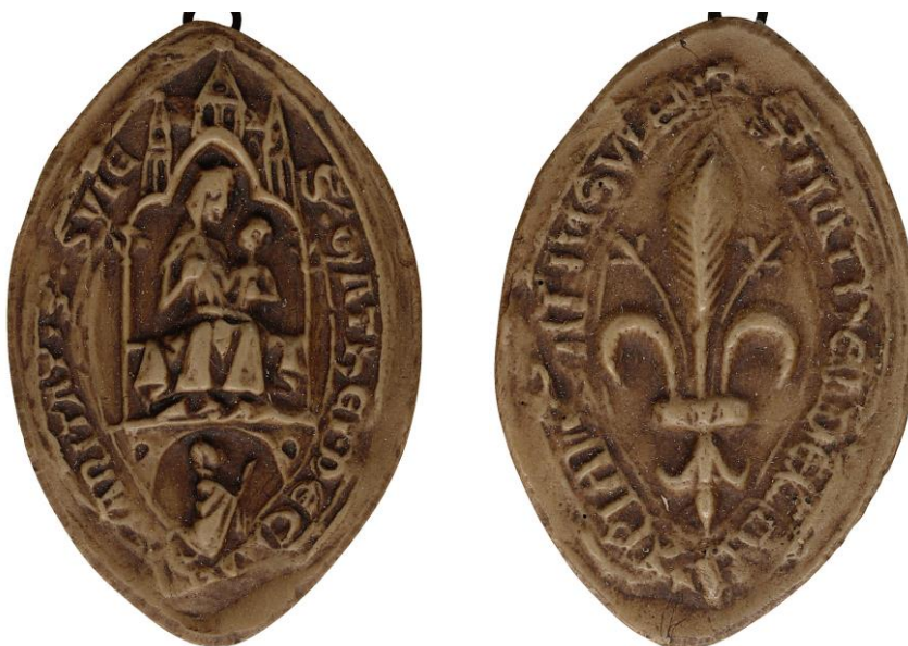
190. Mathieu, doyen de chrétienté de Lille, 1244, h. : 42 mm / S' • MATHEI • DEC[ANI XPI]ANITATIS • SVLE(nsis) Arch. nat., Sc/F/6499