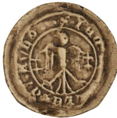
170. N., doyen de chrétienté de Saint-Omer, 1417, Ø 24 mm S' • DEC(ani) [EC]CLE(sie) S(an)C(t)I AVDO(mari) (trois points) Arch. nat., Sc/A/2498