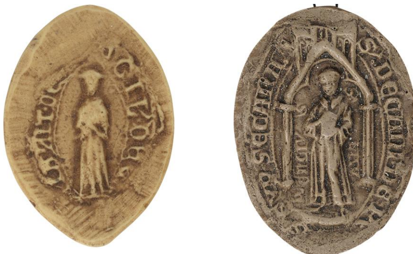
203. N., doyen de chrétienté de Pont-sur-Seine, 1259, h. : 38 mm [...S]IGILL(um) • DEC[ANI XP]ANIT(atis) • DE [...] Arch. nat., Sc/Ch/1991