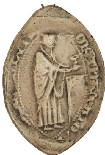
123. Robert, doyen de chrétienté de Saint- Quentin, 1231, h. : 44 mm [...R]OB(er)TI DECA[NI...] Arch. nat., Sc/P/1274