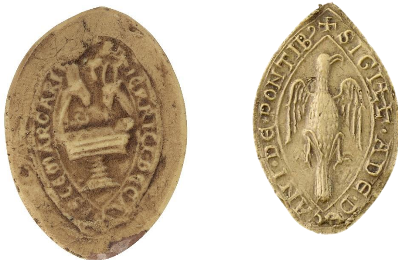
201. Thierry , doyen de chrétienté de Margerie, 1245, h. : 45 mm S' TIERRICI DECANI S(an)C(t)E MARGARET[E] Arch. nat., Sc/Ch/1989