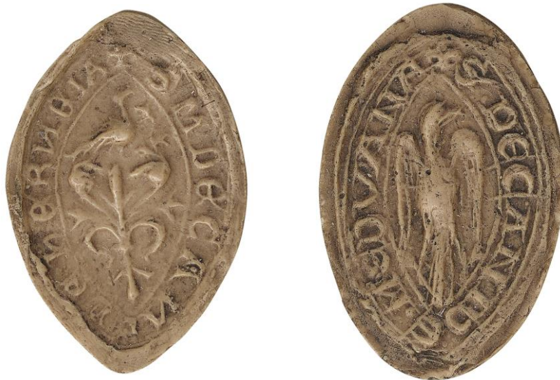
110. Michel, doyen de chrétienté d'Érnée, 1246, h. : 37 mm