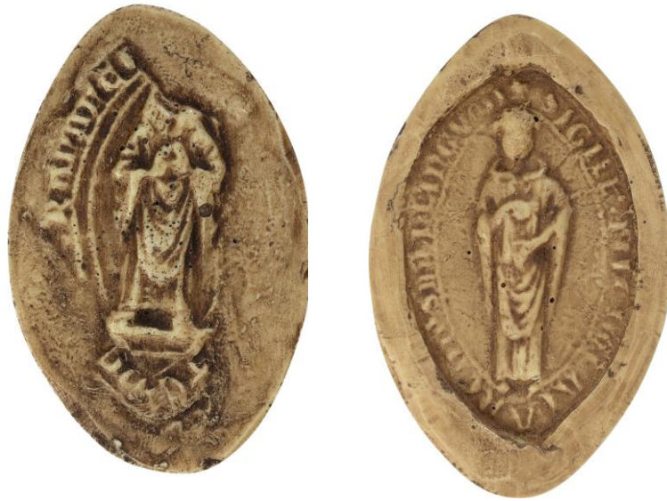
94. Jean de Chaumes, doyen de chrétienté de Grancey, 1302, h. : 40 mm [...]TE DE [G]RANCE Arch. nat., Sc/Ch/1981