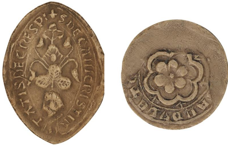
102. Th., doyen de chrétienté de Crépy, 1226, h. : 44 mm ✠ S' DECANI CRISTIANITATIS DE CRESPI Arch. nat., Sc/P/1269