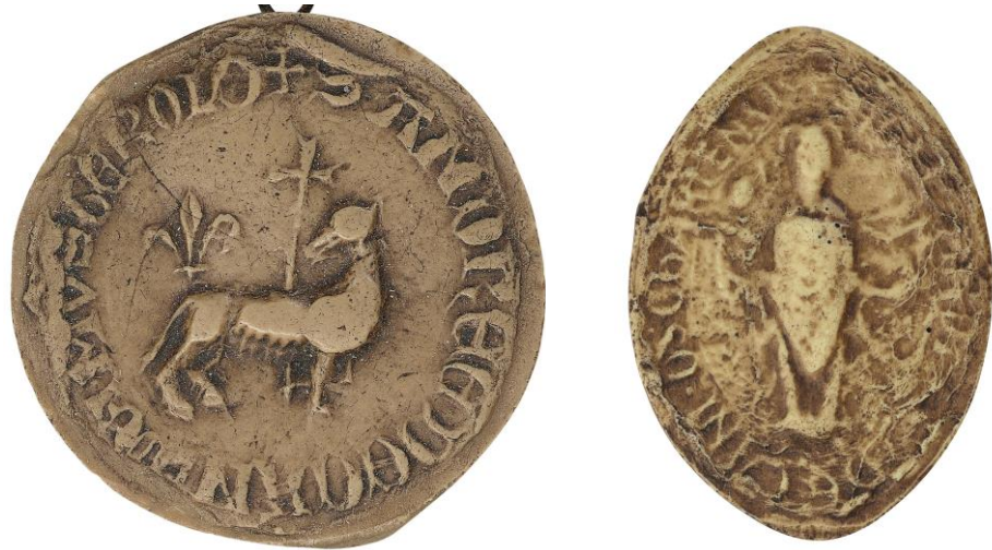
160. André, doyen de chrétienté de Montereau, 1274, Ø 40 mm ✠ S ANDREE DECANI DE MVSTEROLO Arch. nat., Sc/D/7915