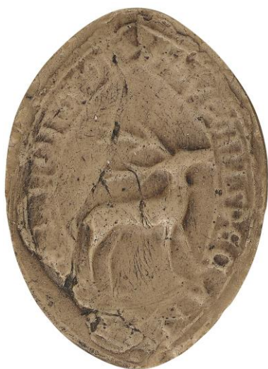
129. Hugues, doyen de chrétienté de Beaumont-en-Argonne, 1239, h. : 45 mm S • HVGONIS DECANI [DE B]ELLOMON(te) Arch. nat., Sc/D/7878