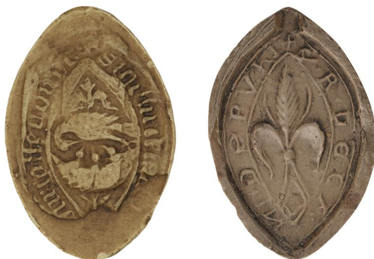
133. Isembart Mouvieult, doyen de chrétienté de Bourgtheroulde, 1465, h. : 35 mm ✠ SIGILLV(m) DECANI DE] BURGOTHEROUDE Arch. nat., Sc/N/2488