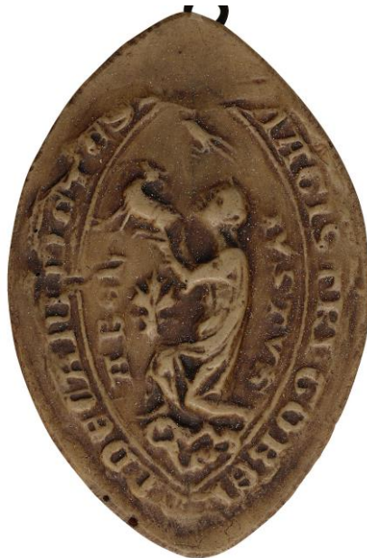
120. Gobert, doyen de chrétienté de Metz, 1308, h. : 48 mm [...M]AGISTRI • GOBERTI • DECANI METE( nsi )S Arch. nat., Sc/F/6505