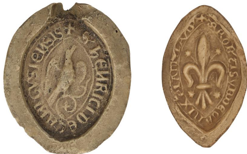
104. Henri, doyen de chrétienté de Guise, 1203, h. : 35 mm ✠ S HENRICI DECANI GVISIENSIS Arch. nat., Sc/D/7894