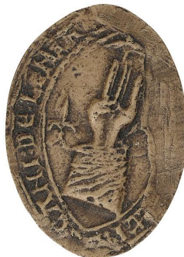
124. Thomas, doyen de chrétienté de Lagny, 1199, h. : 40 mm ✠ SIGI[...] LANIACI Arch. nat., Sc/Ch/2044