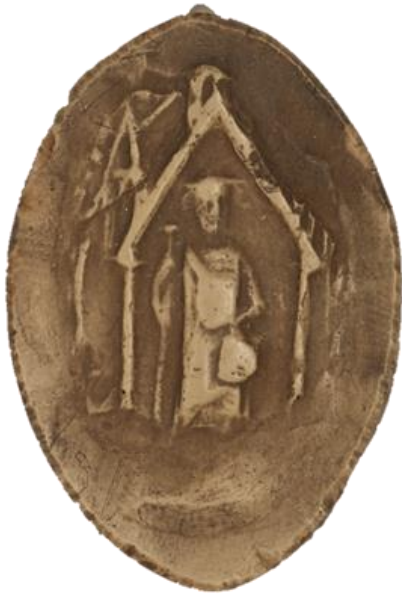
9. N., doyen de chrétienté de Montdidier, 1296, h. : 40 mm Légende détruite Arch. nat., Sc/P/1272