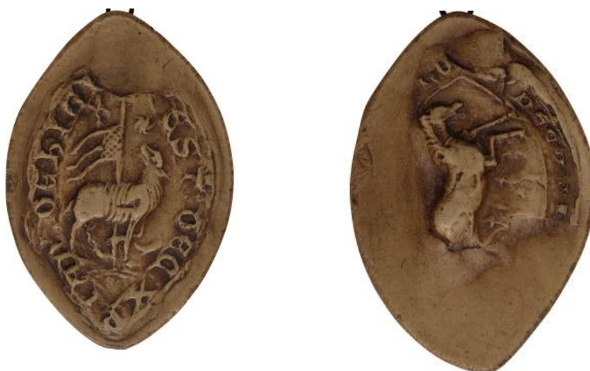
14. Étienne, doyen de chrétienté de Hénin, 1246, h. : 45 mm [...] EST(efani) : DEC(ani) : XPIAN(itatis) : DE : HIN[NIACO] Arch. nat., Sc/F/6494