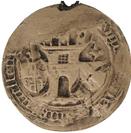
119. N., doyen de chrétienté de Melun, 1476, Ø 35 mm Légende illisible Arch. nat., Sc/D/7904