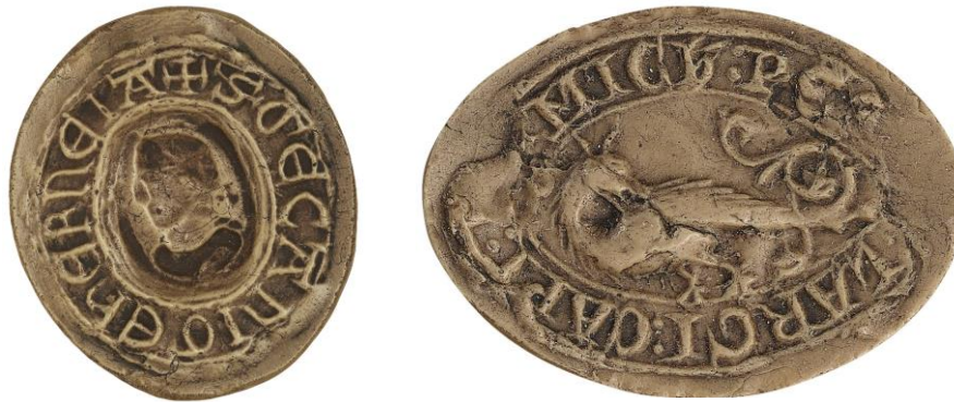
108. G., doyen de chrétienté d'Érnée, début XIII e s., h. : 42 mm