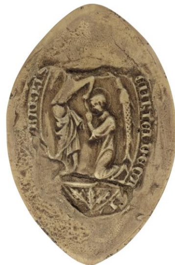
63. Hugues, doyen de chrétienté de Bar-sur-Aube, 1290, h. : 50 mm [...] HVGO[NIS...] Arch. nat., Sc/Ch/1959