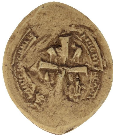
198. Jacques, doyen de chrétienté de Brienne, 1272, h. : 38 mm [...] MAG(ist)RI IACOBI [...]DEC]ANI [...] Arch. nat., Sc/Ch/1965