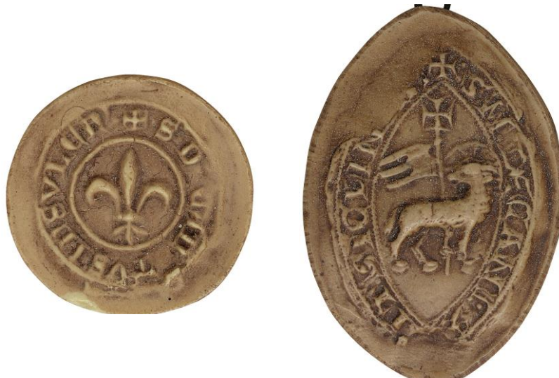
194. N., doyen de chrétienté de Lille, 1341, Ø 20 mm ✠ • S' DECAN[A]TVS INSVLEN(sis) Arch. nat., Sc/F/6479