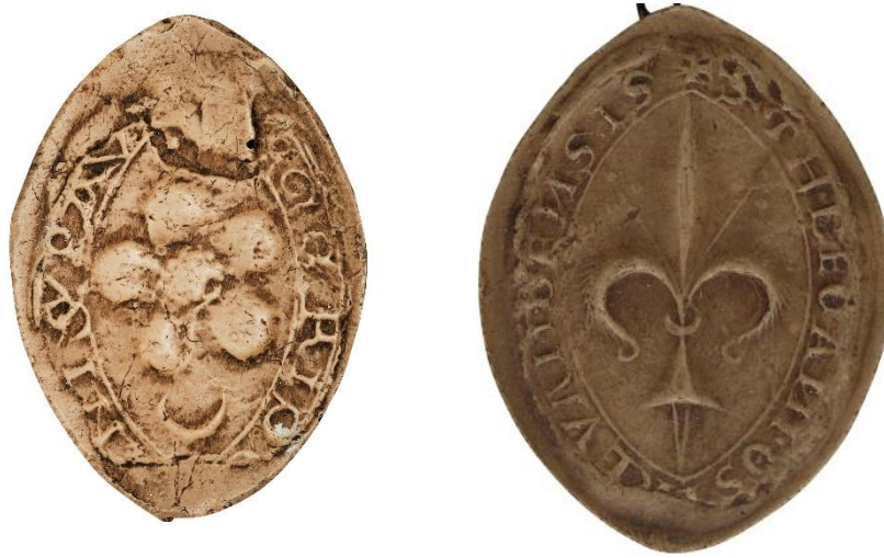
16. Oger, doyen de chrétienté de Saint-Pol, 1235, h. : 47 mm [...] OGERI DE[CA]NI S(ancti) • PAV[LI] Arch. nat., Sc/A/2500