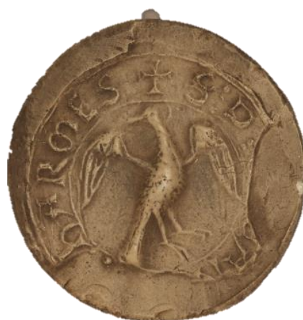
22. Landry, doyen de chrétienté de Chambly, 1258, h. : 35 mm