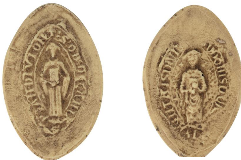
82. Eudes, doyen de chrétienté de Dijon , 1234, h. : 31 mm ✠ S' : OD(onis) DECANI XPIAN(itatis) DIVION(ensis) Arch. nat., Sc/Ch/1973