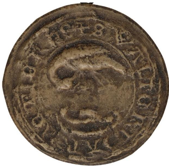
10. Gautier d'Armentières, doyen de chrétienté de La Bassée, fin XII e s., Ø 40 mm ✠ S' WALTERI D'ARMENTIERES Arch. nat., Sc/F/6496