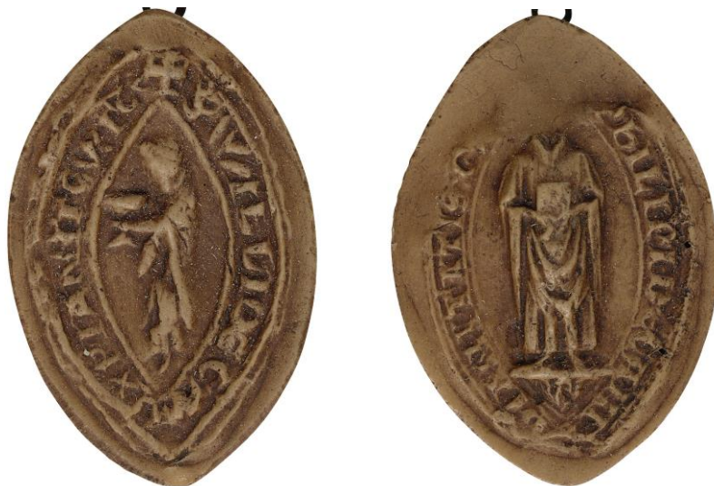
186. Guillaume, doyen de chrétienté de Courtrai, 1238, h. : 44 mm ✠ S' WILL(elm)I DECANI XPIANI(at)is CVRT(ra)C(ens)is Arch. nat., Sc/F/6486