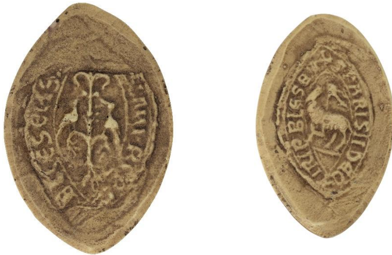
184. Manassès, doyen de chrétienté de Rivière de Blaise, 1247, h. : 45 mm [...D]ECANI RIPA[RIE] BLESENS[...] Arch. nat., Sc/Ch/2054