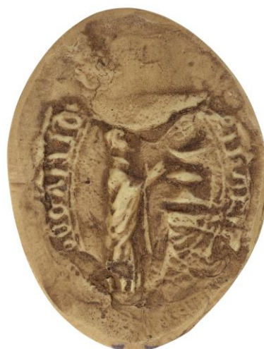
100. Jean, doyen de chrétienté de Saint-Vinnimère, 1270, h. : 50 mm [...] DECANI [...] Arch. nat., Sc/B/1173