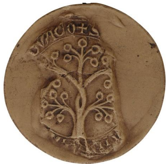
11. R., doyen de chrétienté de Douai, 1225, Ø 50 mm ✠ S[...]ANI[...] DVACO Arch. nat., Sc/F/6488