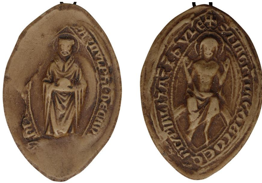
192. Arnoul, doyen de chrétienté de Lille, 1256, h. : 40 mm S'ARNVLPHI • DECANI [...]NIT[...] Arch. nat., Sc/F/6501