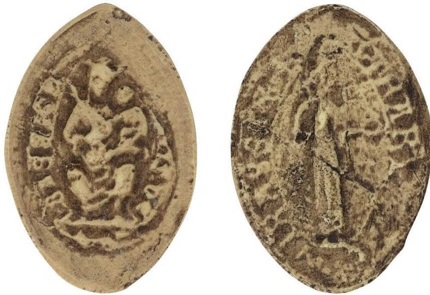
69. Jean, doyen de chrétienté du Bassigny, 1241, h. : 35 mm [...] DE BASSIGN[EIO] Arch. nat., Sc/Ch/2016