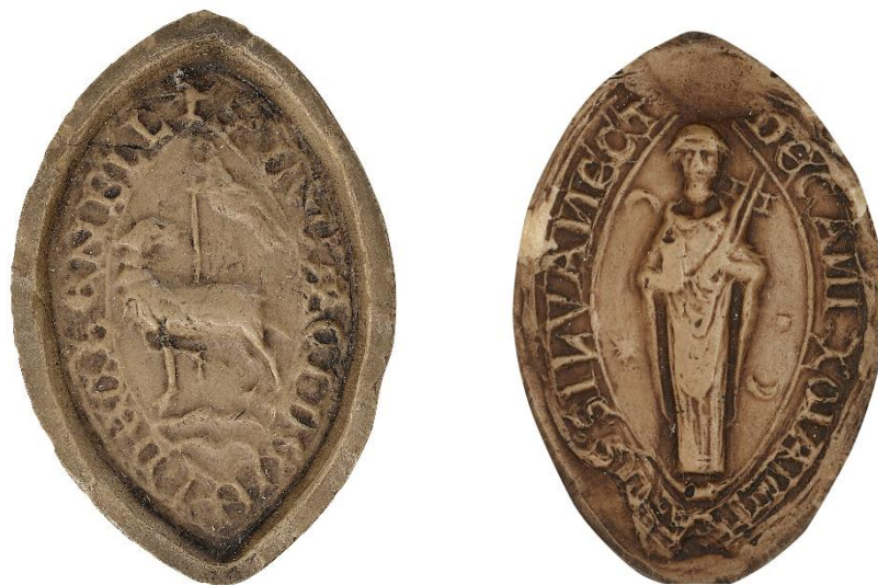
151. Bouchard, doyen de chrétienté de Boran, 1219, h. : 50 mm ✠ S' BUCARCI DECANI DE CHENBELL(i) Arch. nat., Sc/D/7880