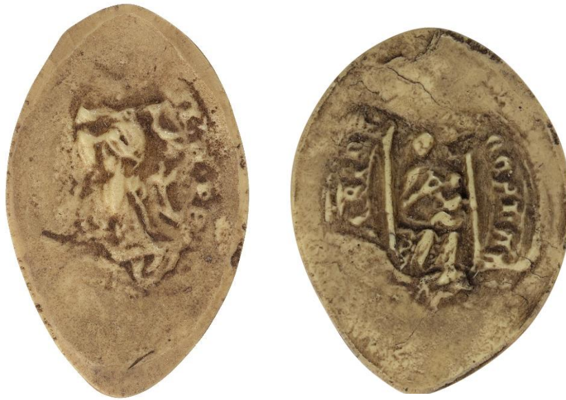
176. N., doyen de chrétienté de Reynel, 1312, h. : 30 mm Légende détruite Arch. nat., Sc/Ch/1994