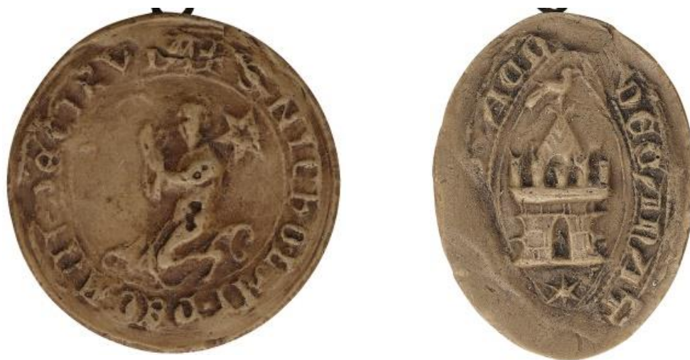
29. Nicolas, doyen de chrétienté de Chièvres, 1231, Ø 33 mm ✠ S NICHOLAI • DECANI • DE • CIRVIA Arch. nat., Sc/F/6485