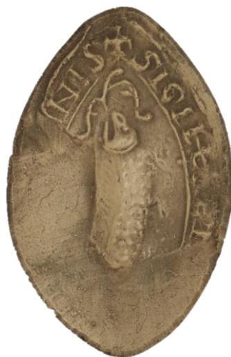
5. P., doyen de chrétienté d'Abbeville, 1267, h. : 46 mm