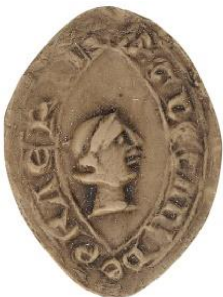
24. G., doyen de chrétienté de Presles, 1249,