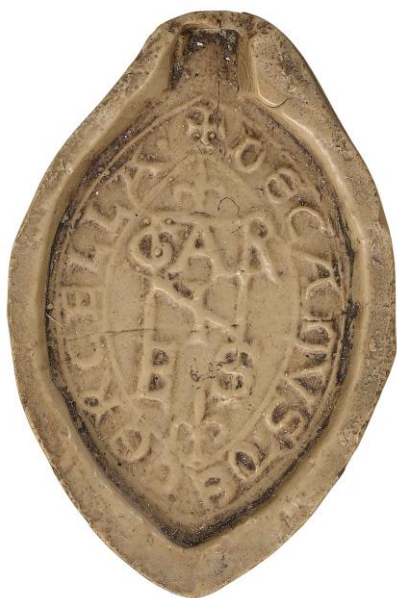
128. Garnier, doyen de chrétienté de Sarcelles, 1219, h. : 37 mm ✠ DECANVS DE CERCELLA • Arch. nat., Sc/D/7928