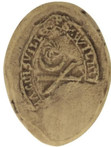
2. Wilard, doyen de chrétienté d'Abbeville, 1237, h. : 40 mm ✠ S' • WILAR[DI ...] ABBISVILLE Arch. Nat., Sc/Ch/1949