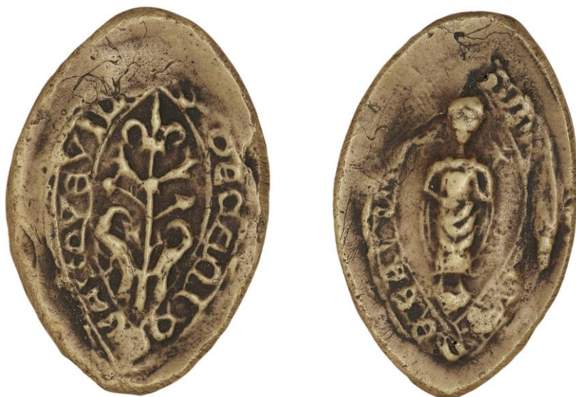
131. N., doyen de chrétienté de Bacqueville-en-Caux, 1285, h. : 28 mm S' DECANI DE BACQVEVIL[...] Arch. nat., Sc/N/2486