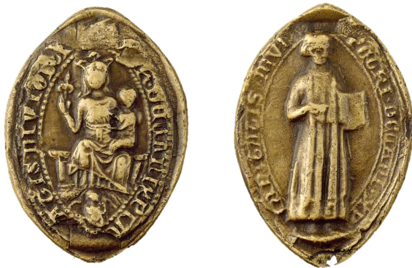
88. Guy, doyen de chrétienté de Dijon, 1277, h. : 50 mm [...] H • DECANI KP[A]NITATIS : DIVIO[...] Arch. nat., Sc/B/1178