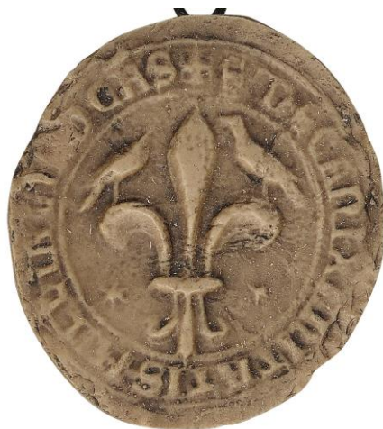
157. Nicolas, doyen de chrétienté du Gâtinais, 1262, Ø 28 mm ✠ S' NICOL(ai) DECANI VASTIN(ensis) Arch. nat., Sc/D/7891