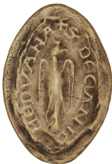
107. Geoffroy, doyen de chrétienté de Moyaux, 1277, h. : 35 mm ✠ S' DECANI D(e) MEDVANA Arch. nat., Sc/N/2495