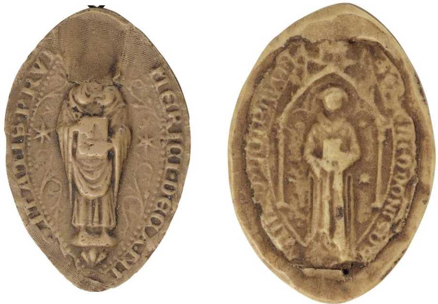
162. Émery, doyen de chrétienté de Provins, 1233, h. : 53 mm [...]MERICI DECANI [...]ITATIS PRV[...] Arch. nat., Sc/D/7922