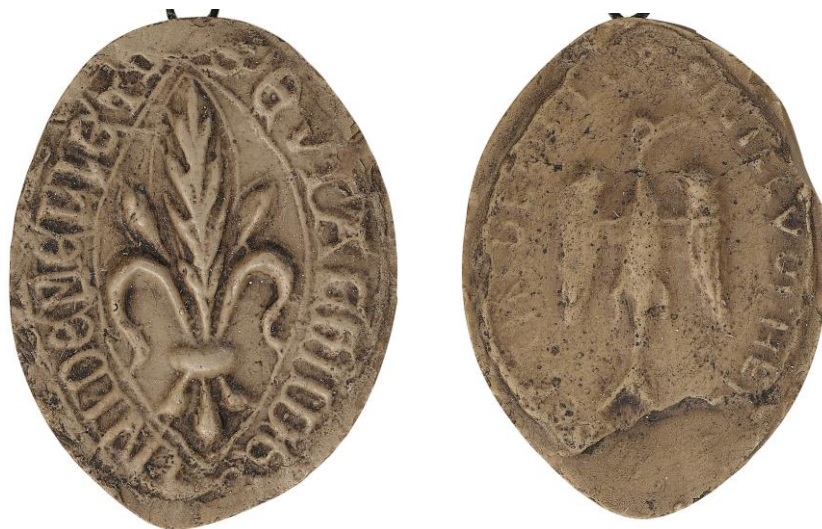
141. Eustache, doyen de chrétienté de Meulan, 1230, h. : 40 mm S' EVSTACHII DECANI DE MELLETO Arch. nat., Sc/D/7908