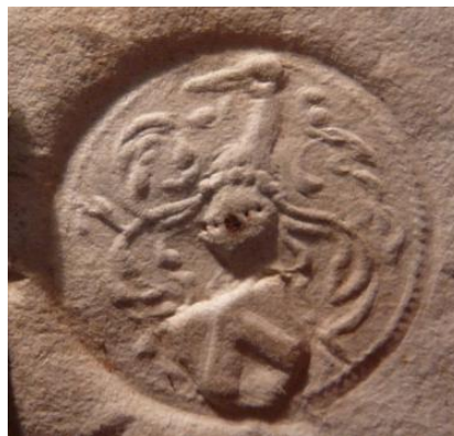
53. Empreinte de cachet de D. de la Cambe, dit Ganthois. Le cimier consiste en une tête d'oiseau, héron ou cigogne, émergeant des lambrequins découpés AD Nord, B/18021 (ancienne chambre des comptes, Lille, 1557)