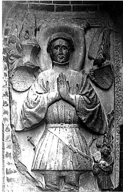
47. Monument funéraire de Wargnies-le-Grand (Nord)

La plupart du temps les cimiers contournés sont inclus dans des séries où les écus se font face ( fig. 46 ) : sur des monuments funéraires ( fig. 47 ), sur des bijoux, dans le décor de chapelles, les tableaux des ordres de chevalerie 13 , sur certains sceaux comme ceux utilisés au XIV e siècle par les amiraux et maréchaux de France où deux écus se font face.