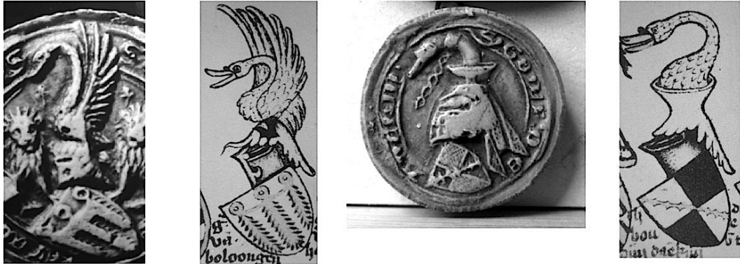
48. (de gauche à droite) Cimier au cygne de Jean, comte de Boulogne (1365).

une certaine similitude d'inspiration (fig. 48), jusqu'à quel point les héralds d'armes ou les compilateurs d'armoriaux reproduisaient consciencieusement les images portées sur les sceaux qu'ils avaient sous les yeux ?