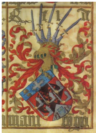
Armoiries du Manicongo (le roi du Congo) - Livro da Nobreza e Perfeçam das Armas , Arquivo Nacional da Torre do Tombo, Casa Real, Cartório da Nobreza, liv. 20, fl. 7

Acculturations héraldiques : les concessions d'armoiries par les rois de Portugal à des souverains africains et asiatiques du XV e au XVII e siècle